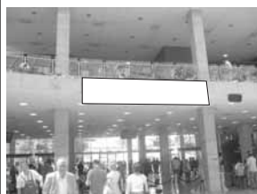
Transparent 5 x 1 m