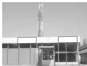
Transparent 3 x 1,5 m