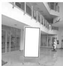
Pano 1 x 2 m